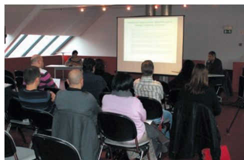
Galerie photos de la rencontre du 18 février 2010

Le partenariat et la source de financement dans le cadre du cours d'alphabétisation, la problématique de la violence conjugale et ses répercussions sur les populations immigrées, le suivi des demandeurs d'asile qui sortent des structures ILA, la réédition du cycle de conférence sur l'immigration en Belgique et du module de formation "Permis de conduire" pour le public des partenaires, le travail sous-commission dans le cadre du PLI sont des sujets relevés par les participant à la réunion du comité d'accompagnement.